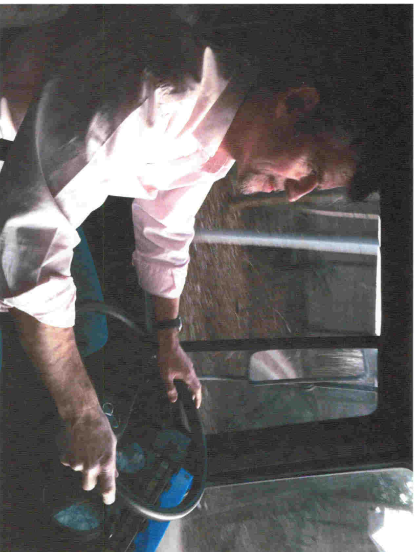
Abenteuerliche Überführung: Mit einem 26 Jahre alten LKW ohne TÜV vom Westerwald nach Wesseling.